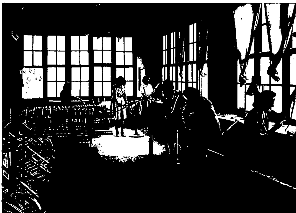
Elbar, 1948. Mujeres en la sección de Filetado de Bicicletas de la empresa Norma. . Digitalización realizada a partir de un negativo de gelatino-bromuro sobre placa de vidrio. 13x18 cm. Sig. 090711